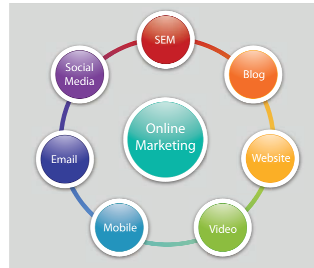
Die Online Marketing Instrumente wirken synergetisch zusammen.

Blogs und Mobile Apps sind zusätzlich zur Website ideale Medien, um solche Inhalte zu präsentieren und weitere Besucher anzu-